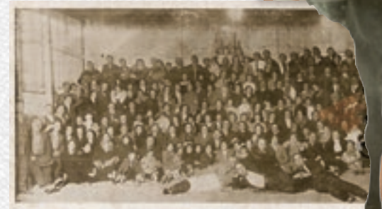
Anguanejos en Argentina (1935).