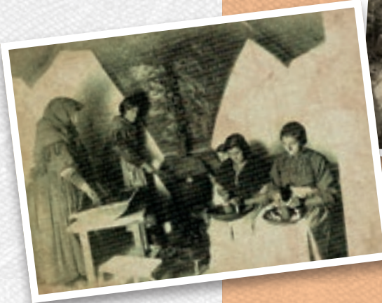
Matanza (1934). Pastorcillo (1936). Trilla (1946). Lavando en el río (1936).